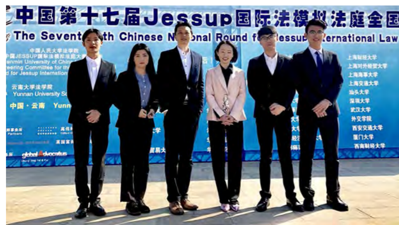
第十七届杰赛普国际法模拟法庭全国选拔赛 一等奖