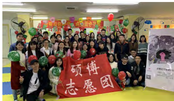
硕博志愿团举办“点亮心灯，与爱相伴”关爱自闭症儿童活动