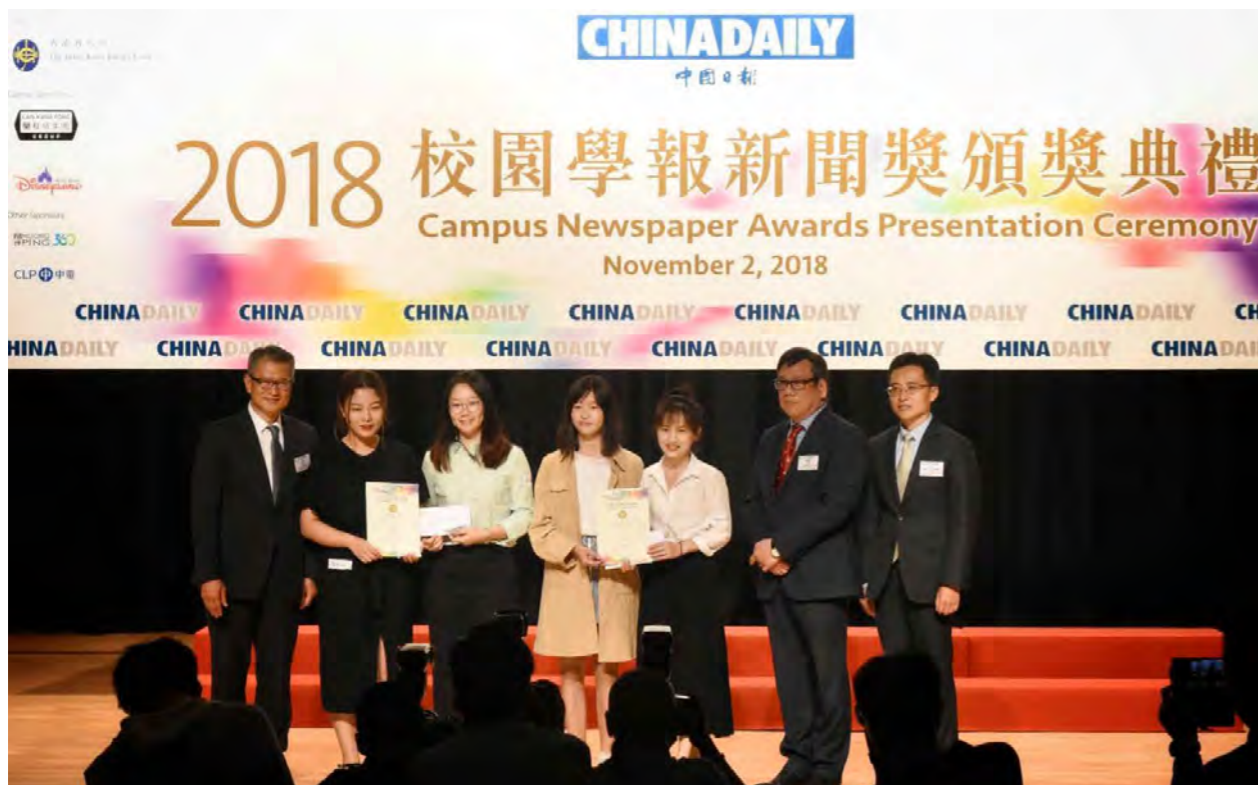
2018 校园学报新闻奖颁奖典礼 最佳专题摄影图片季军 最佳新闻报道季军