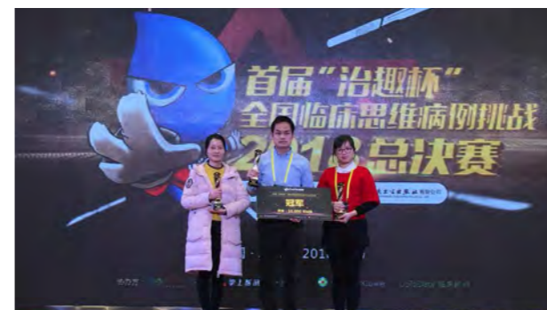
首届“治趣杯”全国临床思维总决赛 冠军