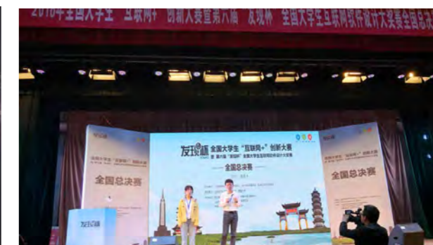
2018 年全国大学生“互联网+”创新大赛暨第六届“发现杯”全国大学生互联网软件设计大赛总决赛 全国一等奖和“最具投资价值”创业大奖