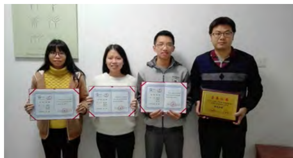
2018 年全国大学生数学建模竞赛 全国一等奖