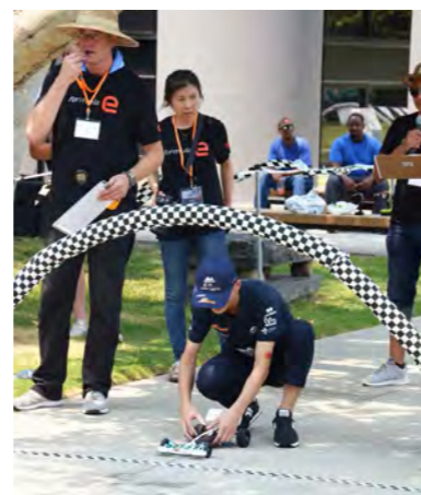
2018 弹力方程式国际设计锦标赛 获多项大奖