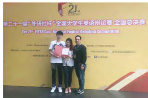
“外研社杯”全国大学生英语辩论赛全国总决赛 一等奖