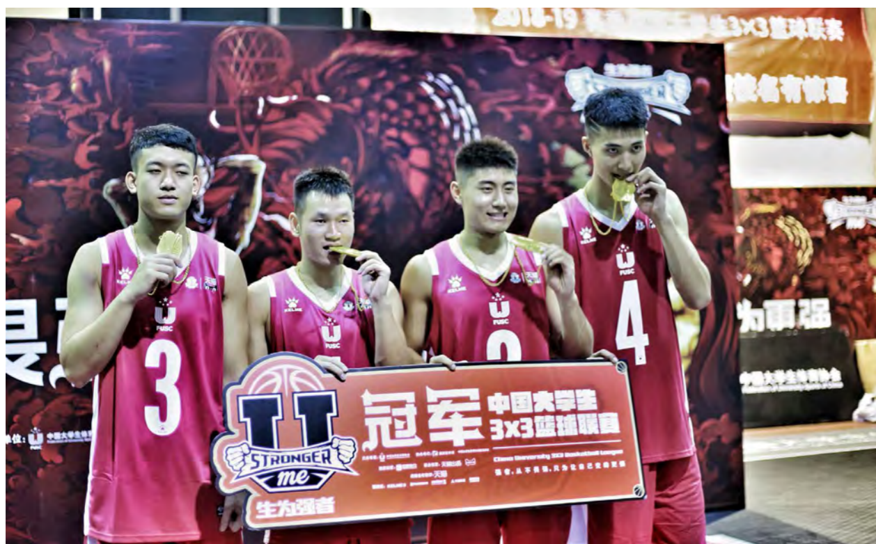
汕大学生获中国大学生 3X3 篮球联赛广东赛区冠军

2018 年汕头大学高水平篮球队屡创佳绩。1 月，代表广东赛区参加中国大学生 3×3 篮球联赛总决赛。3 月，获得第二十届中国大学生篮球联赛 CUBA 东南赛区第八名。11 月，卫冕中国大学生 3×3 篮球联赛广东赛区冠军，获得广东省第十八届大学生篮球联赛男子乙 B 组冠军。12 月，获得第二十一届中国大学生篮球联赛 CUBA 东南赛区广东预选赛第二名。