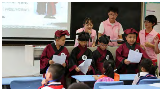
学生志愿者为附小学生上公益课

立足地方，学校组织 1037 名学生志愿者投身到汕头市创建全国文明城市工作中，开展汕头市交通指引志愿服务，服务时数达 2660 小时；充分发挥学生的主人翁精神，组织 330 名学生志愿者参与校园秩序及环境维护工作，为全校师生营造良好的校园学习生活环境。