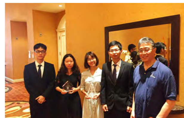
第 54 届国际大学生商业战略竞赛“杰出表现”亚军和“杰出报告”冠军双料大奖